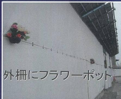
外柵にフラワーポット