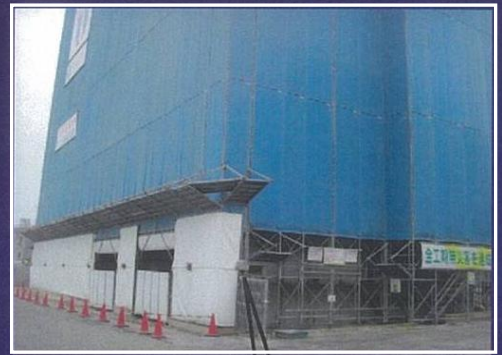
出入口カーブミラー