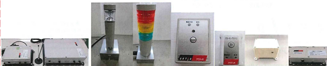
検知器本体12m版 検知器本体 8m版 (ミニBH用)