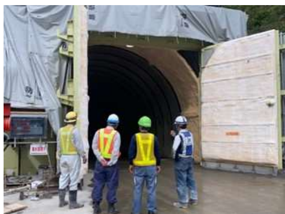
コミパト運動 職長パトロール状況