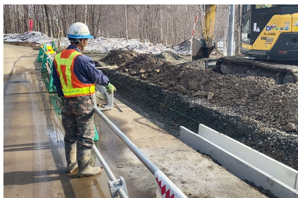
一人KY運動 一人KY状況