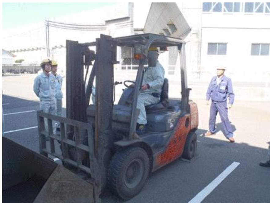
フォークリフトの特性や 死角について実機に乗車し教育