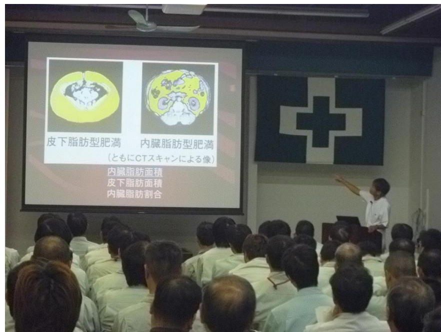
産業医による衛生講演会 講演テーマ「脱！生活習慣病」

外部講師による教育や、産業医による講演を開催し 作業者の安全衛生意識向上を図っています。