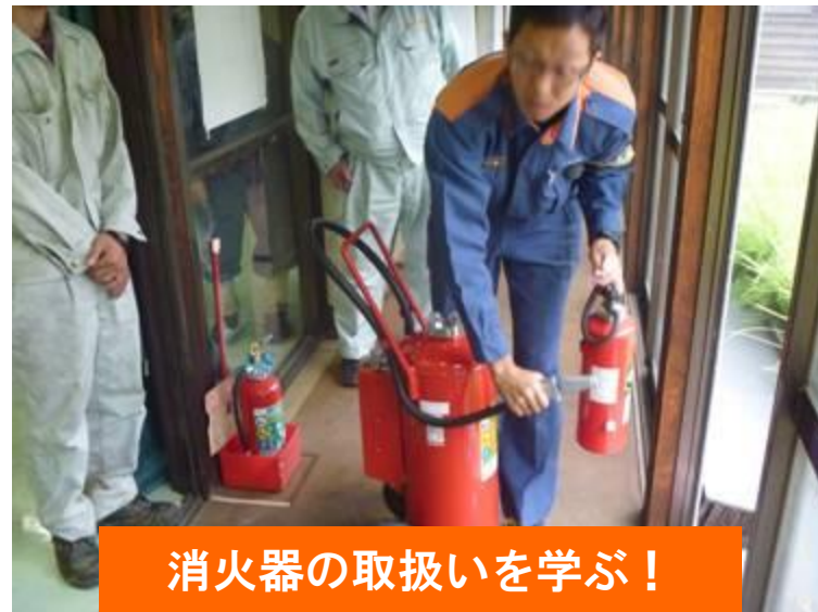
消火器の取扱いを学ぶ！