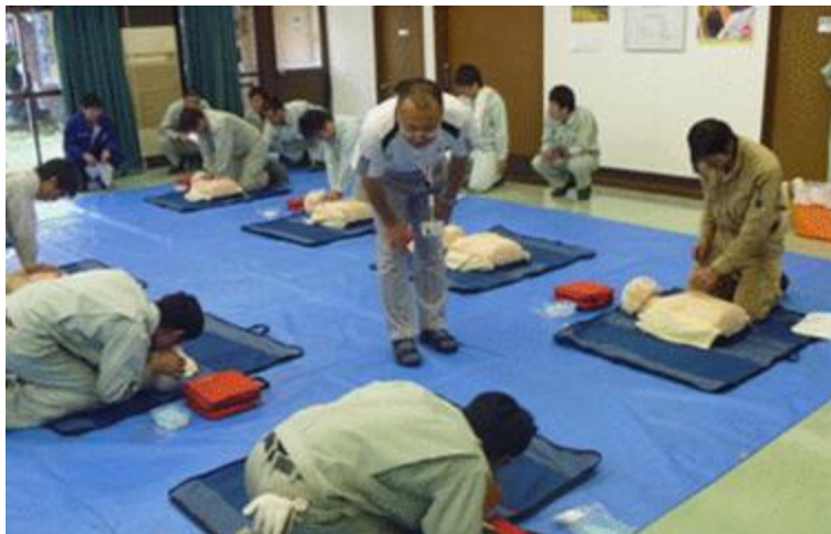
心肺蘇生法（AED含む）を学ぶ！