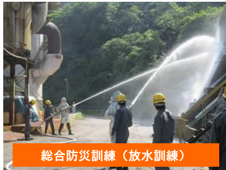
総合防災訓練（放水訓練）

緊急時のために心肺蘇生法講習会や消火器取扱い講習会、総合防災訓練を実施し万一の事態に備えました。