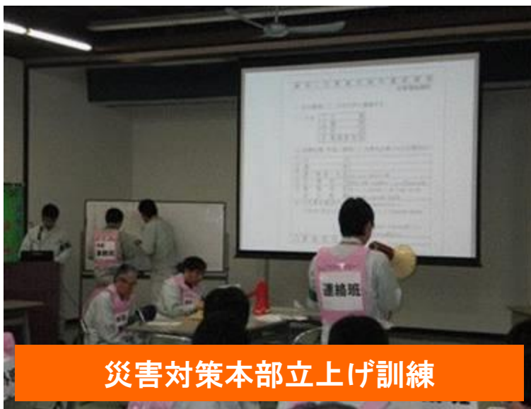
災害対策本部立上げ訓練