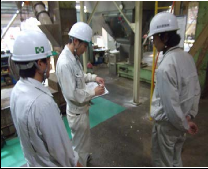
5Sパトローラー→(安全)チェック評価