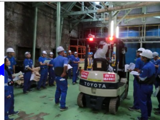
前、後照灯、方向指示器 警報装置の機能