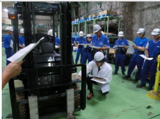
車輪の異常有無点検

■10/10トヨタL&F福岡(株)社を講師に向かえ、『フォークリフトの始業前点検』講習会が各部署から28名の方が参加し行なわれた。目的は安衛則151条の25に定められた作業開始前点検項目を再確認し、日常点検の理解を深め実務に生かすこと。昨年4月の安全講習に続くものと位置付け。