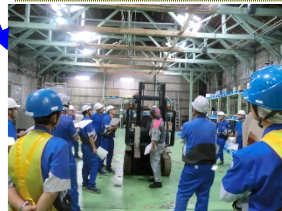
荷役、油圧装置の機能