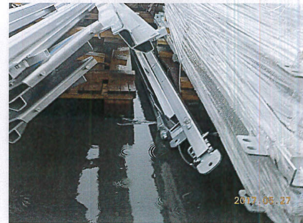
H29.5.27 安全パトロール 指摘事項写真 27枚