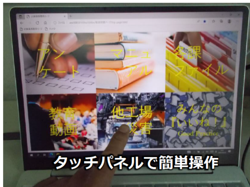
タッチパネルで簡単操作

デジタルサイネージを活用して、全従業員が休憩所で簡単に教育を受けられる タッチパネルで簡単操作 スマホ感覚で災害事例・改善好事例・教育などの動画を視聴