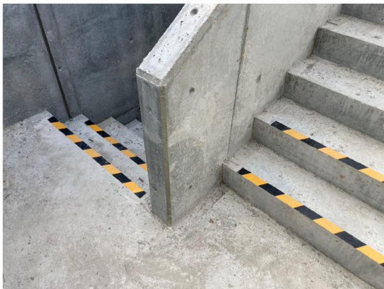
写真① 躯体段差部へのトラテープ表示例