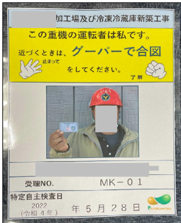
▲ 重機オペレーター顔写真付き 特定自主検査日を記載 (A2サイズ)