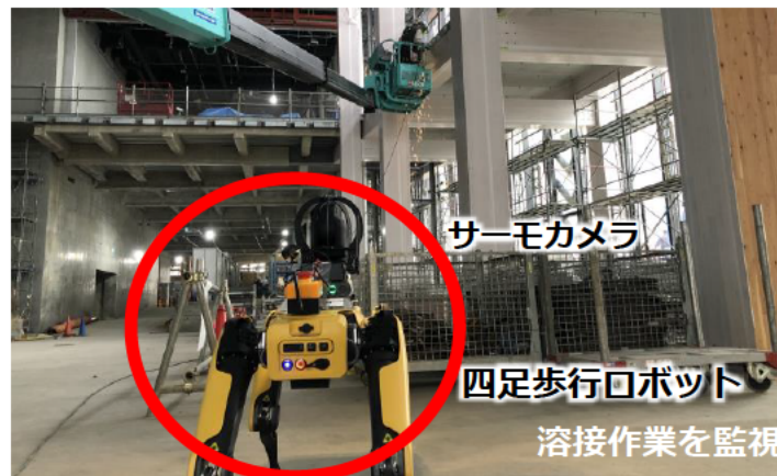
ロボットを遠隔操作で火気作業場所に配置