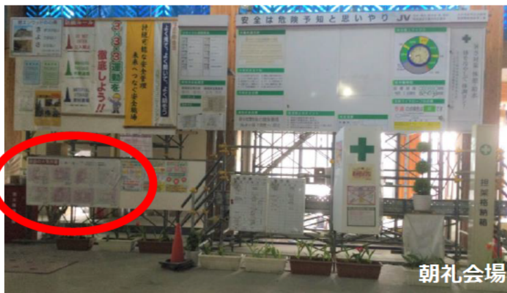
朝礼会場に火気作業場所を記入するボードを設置