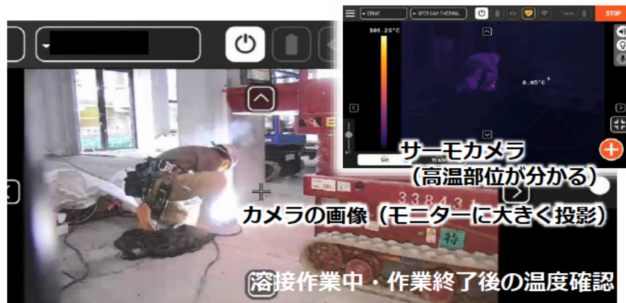
カメラ・サーモカメラ画像（遠隔操作側）