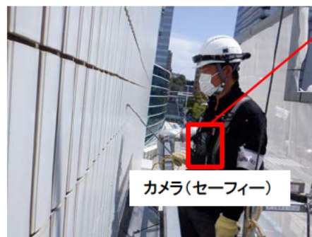
カメラ(セーフィー)