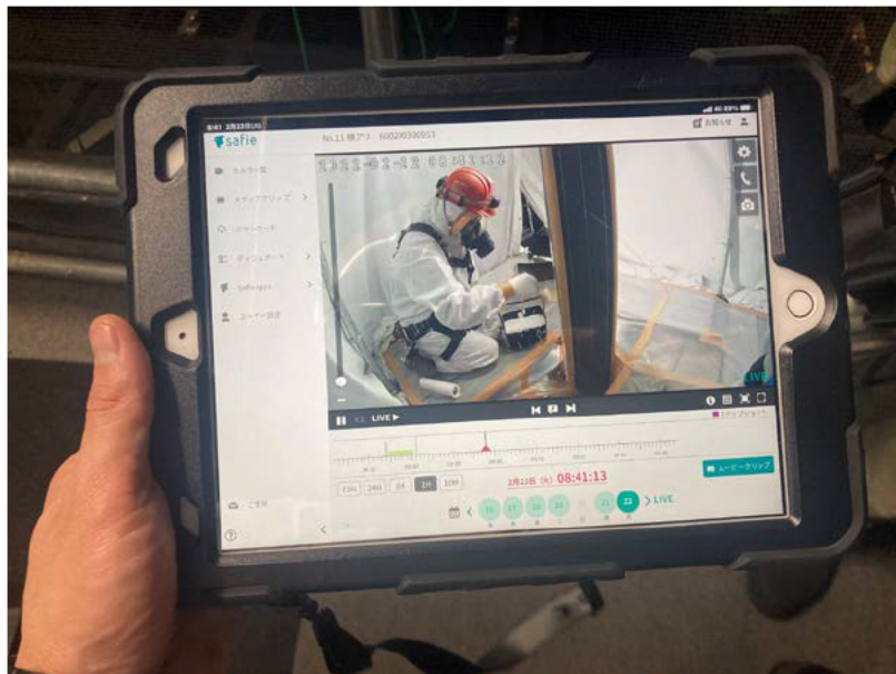
塗膜除去作業時の映像