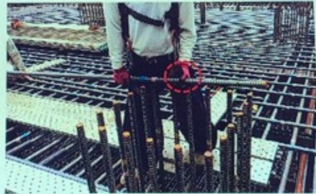
縦筋の間に3人で格子筋(11.05m、99kg)を降ろそうとしたときに、 縦筋と持っている鉄筋(格子筋)の間に指を挟んだ