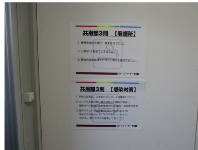
喫煙所入口に掲示『見える化』