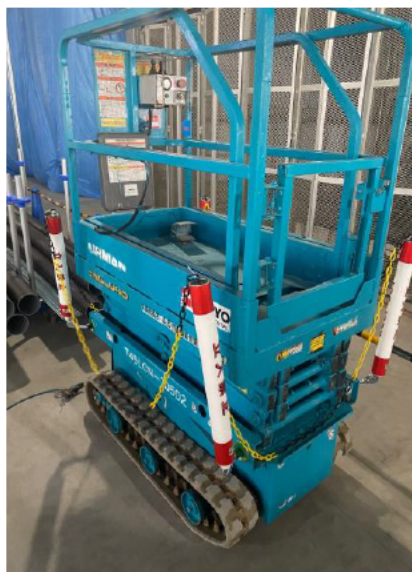
現地での使用状況 左:開いた状態 右:閉じた状態