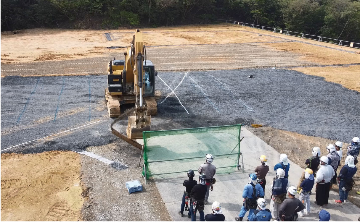
①人に見立てた紙ボイド（170cm,80kg）にバックホウのバケットを高速で当てどれ程の力があるかを実験した。