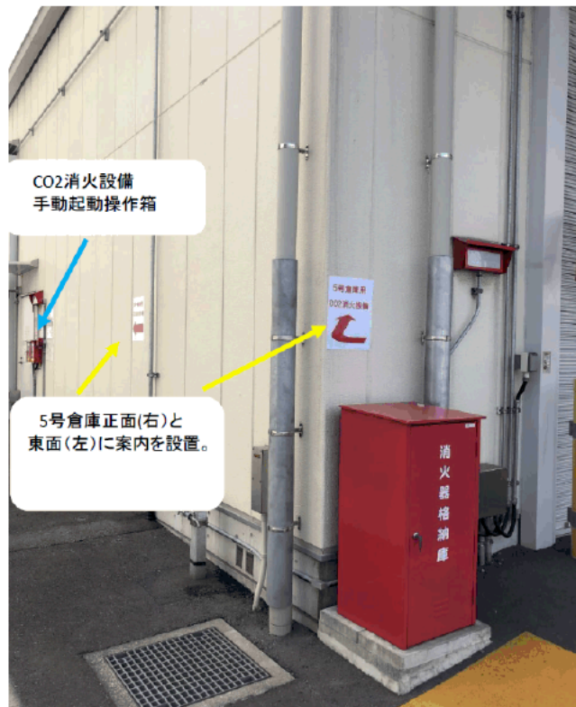
5号倉庫内シャッター付近