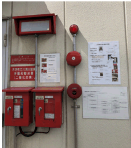
5号倉庫(手動起動装置)