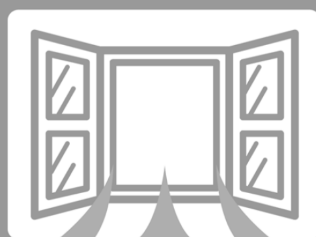
詰所・会議室の換気