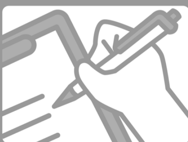
体調記録で健康管理