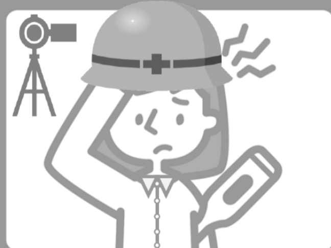
サーモカメラによる検温実施