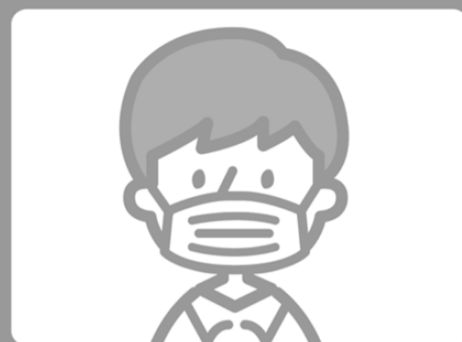
マスク着用 (※熱中症対策中は除外)