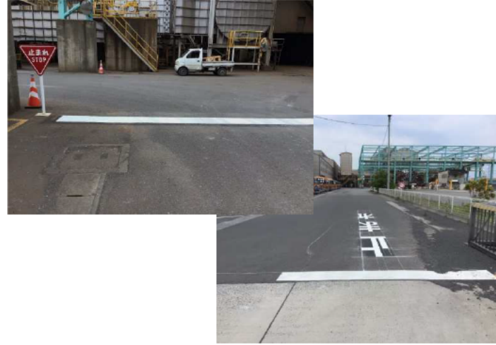
曲がり角、交差点には止まれ標示や標識設置