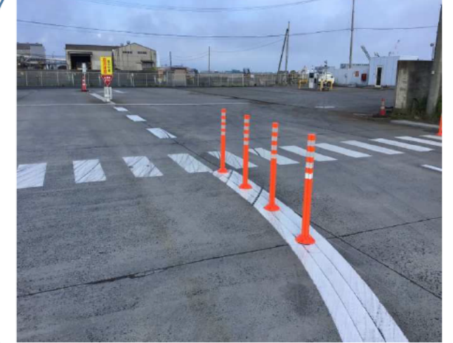
カーブのはみ出し防止ポール設置