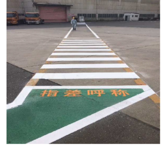
横断歩道と指差呼称