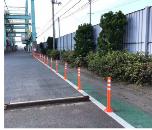
歩道をグリーンロードに、車道側にポスト設置