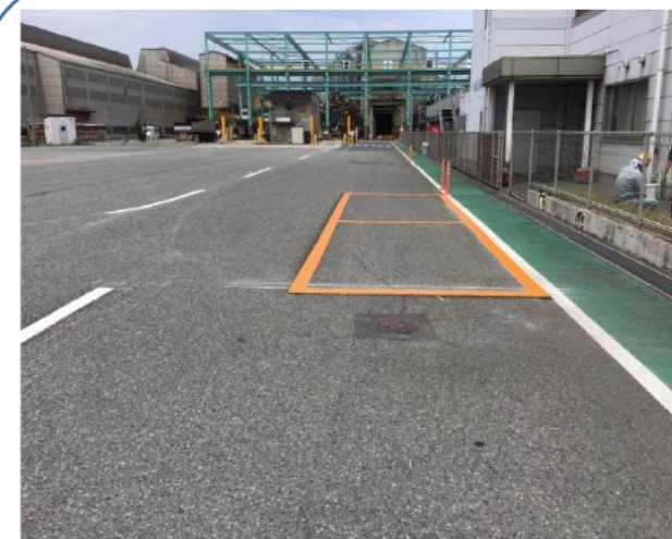
事務所前車両の停車枠表示