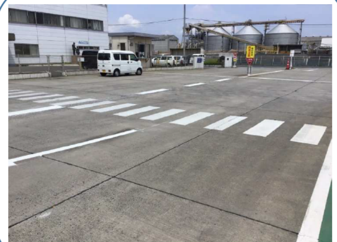
中央分離線と横断歩道