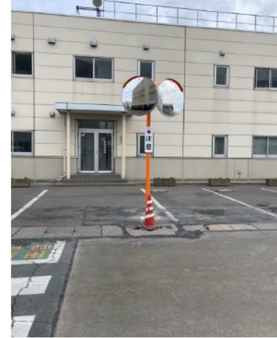
見にくい所にはミラーを設置