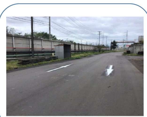
車両通行用の矢印表示