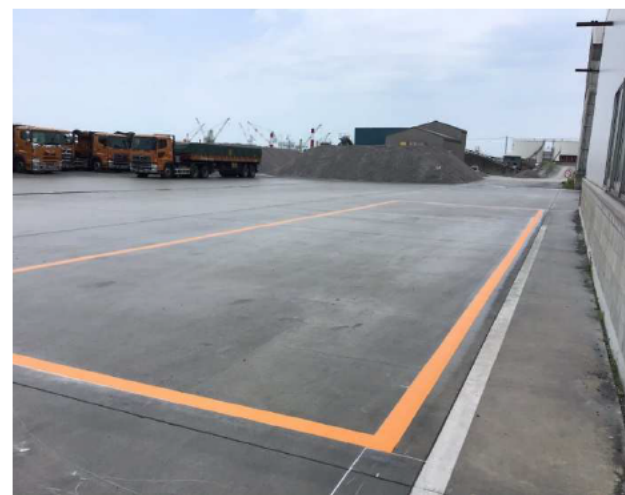
トラック用停車場所には枠表示