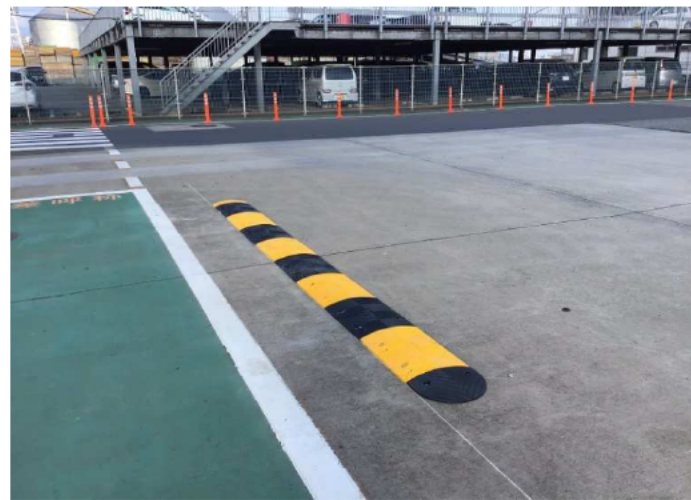
乗用車乗上防止用バンブ設置