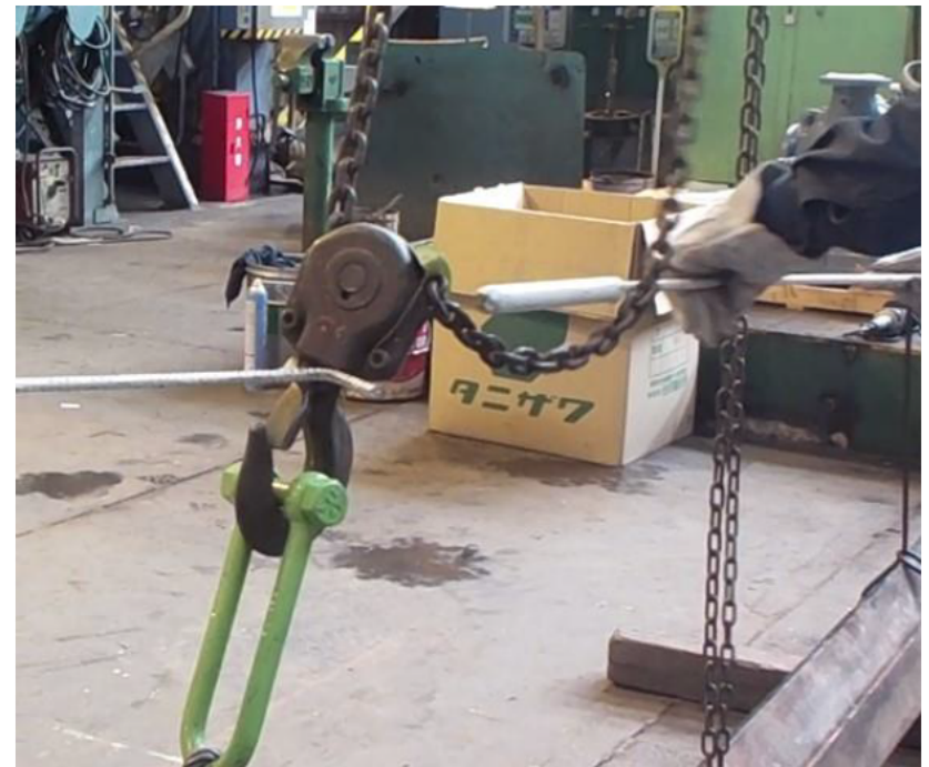
異常動作の再現動画