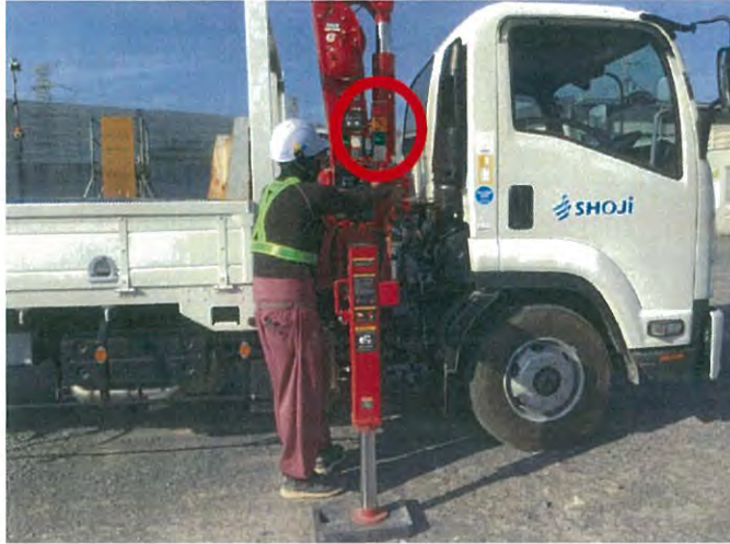
ユニック車の三色灯

クレーン車は有資格の専属オペレーターのみが操作しますが、ユニック車は作業所でも運転手さん作業員さんなど多くの人が操作しています。一般のユニック車は5t未満の技能講習修了で操作が出来、操作も簡単のためユニック車の事故が多く起きています。前方吊り 側方吊りの定格荷重も何んとも少なくないと分かっている状況でしたが、デジタル表示と三色灯色分けで 定格荷重の再認識 が出来ています。