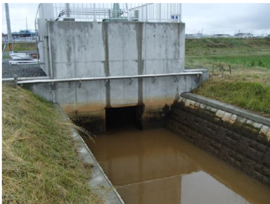
《 取付前 》