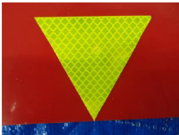
【NETIS 新技術 高輝度材】