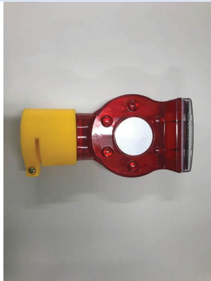
サンライストップ