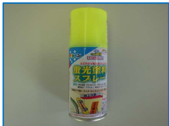
④使用材料(吊フックへの蛍光塗料塗布)