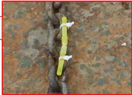
②ケミカルライト設置詳細(ケミホタル)