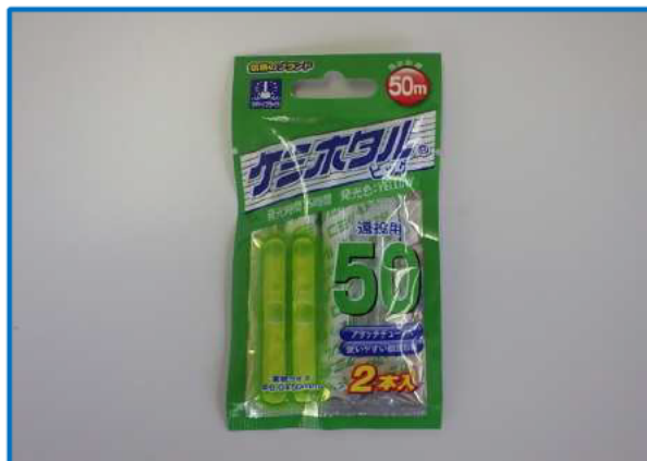
③使用材料(釣り用ケミホタル)