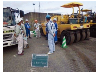
掲示物の周知会を実施