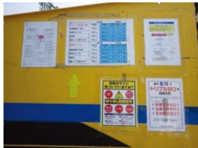
アスファルトフィニッシャー

緊急時の連絡体制、作業変更発生時のルールを全ての重機に掲示し・周知を行い、緊急事態に備え作業に従事しました。