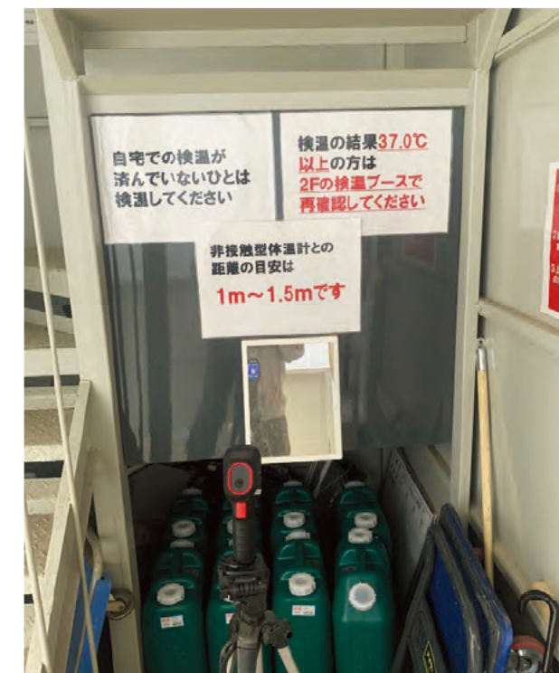
入場時モニターによる 検温チェック実施