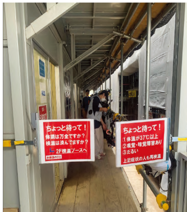
入場前実施事項 チェック確認ゲート