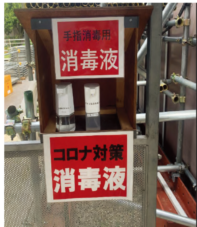
分かりやすい標識による 入場時消毒の啓蒙