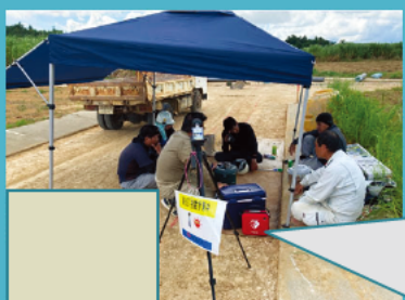
AEDの設置 上級救命講習修了者配置