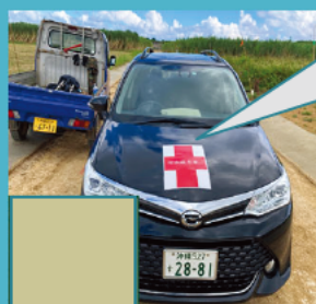
AED・救急箱搭載車の見える化 【現場内の作業箇所移動に対応】