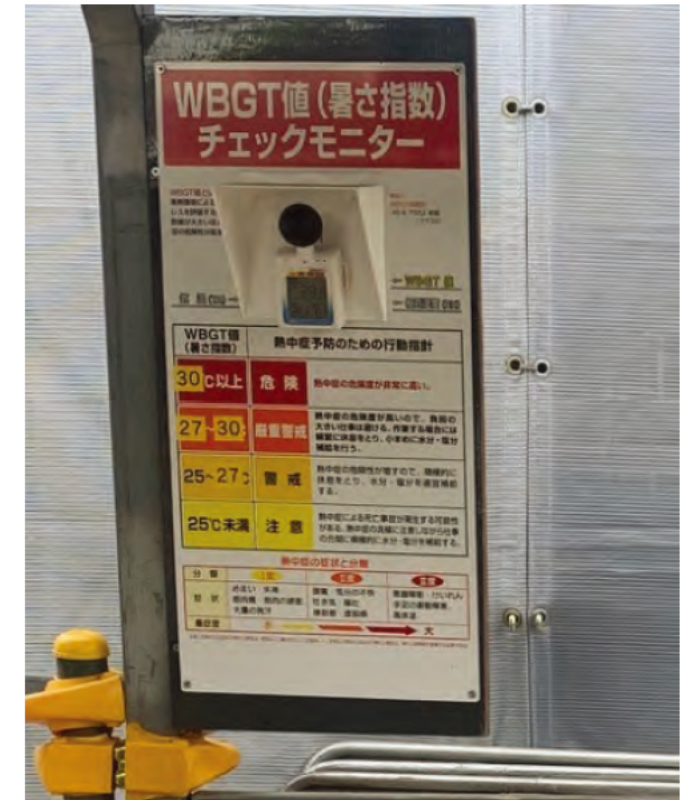
WBGT値(暑さ指数)チェックモニター 設置による暑さ指数の見える化