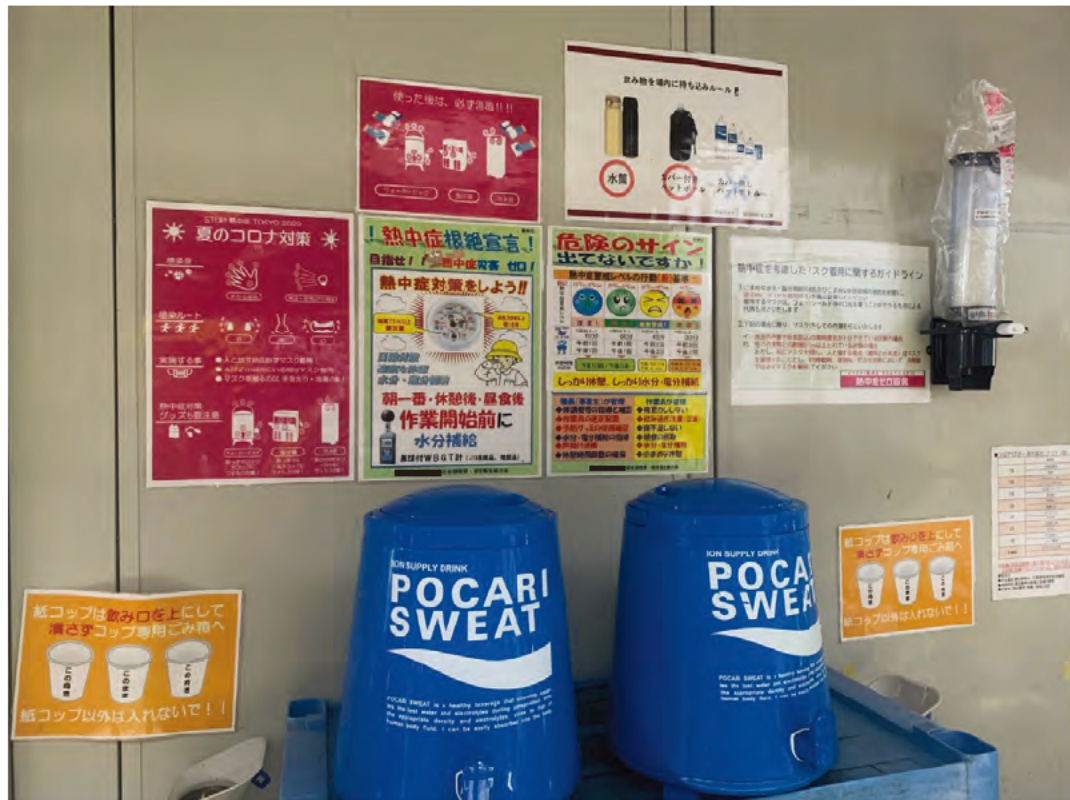
入場ゲート前に設置したポカリウェット給水センター (作業開始前強制給水を実施)