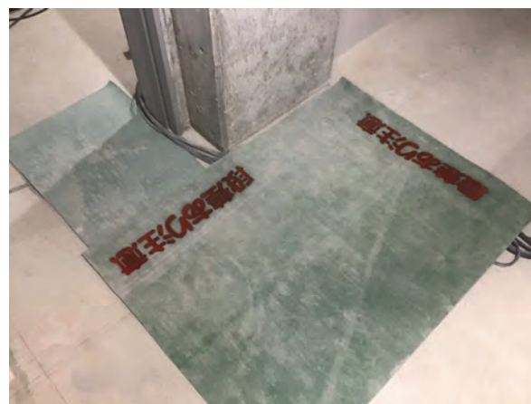
つまずき防止、段差標示

床のコードにつまづかないようにシートで養生し、小さな段差にも注意喚起の標示を行った。