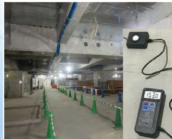
安全通路の明示と十分な照度の確保