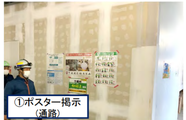
①ポスター掲示 (通路)