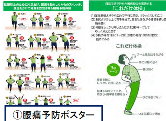
①腰痛予防ポスター