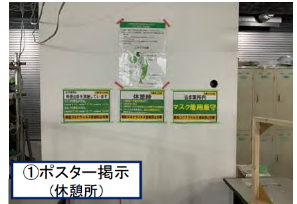
①ポスター掲示 (休憩所)