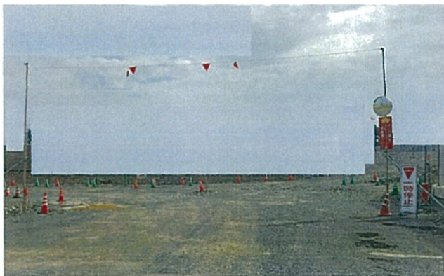
出入り口の上部に設置した高さ制限トラロープと右側に「ダンプ荷台とクレーンブーム用ミラー」

ダンプ荷台の残土積載状況はBHでの積み込み時にオペが確認して出発しますが、走行時の揺れで残土が落下すること、クレーンブームの格納忘れで架空線等を破損したりすることがあります。工事用ゲート手前で一時停止してダンプ荷台とクレーンブームを確認し不具合を修正して場外に出ることが出来ます。