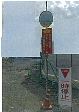
ゲート前に一時停止看板