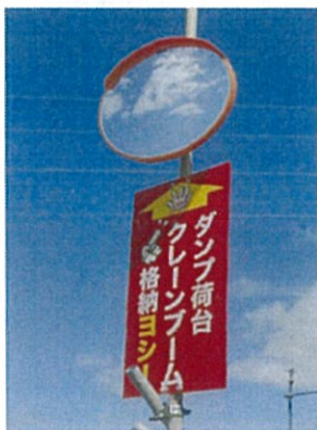
ダンプ荷台とクレーンブーム 格納ヨシ！の表示