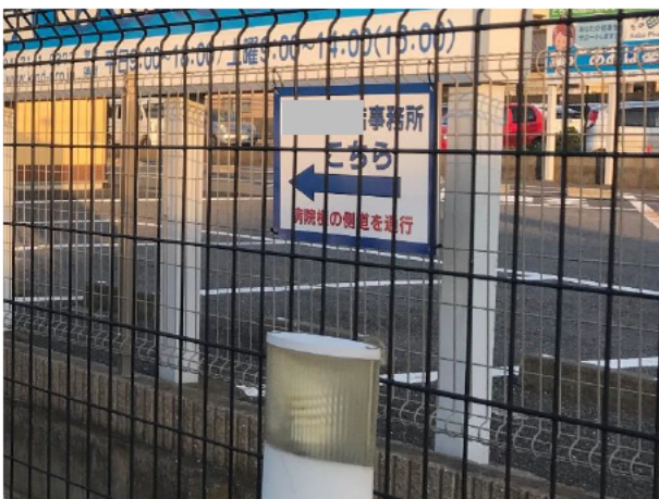
写真③（工事事務所ルート通行案内）