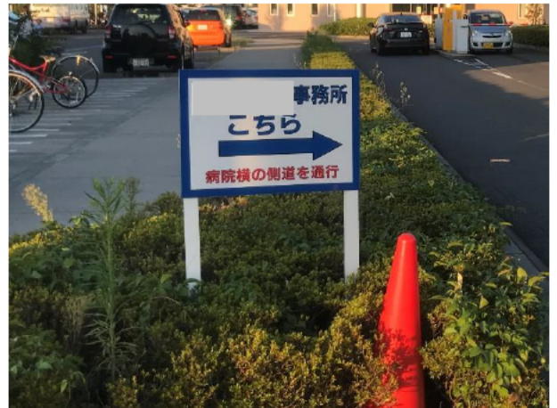
写真②（工事事務所ルート通行案内）