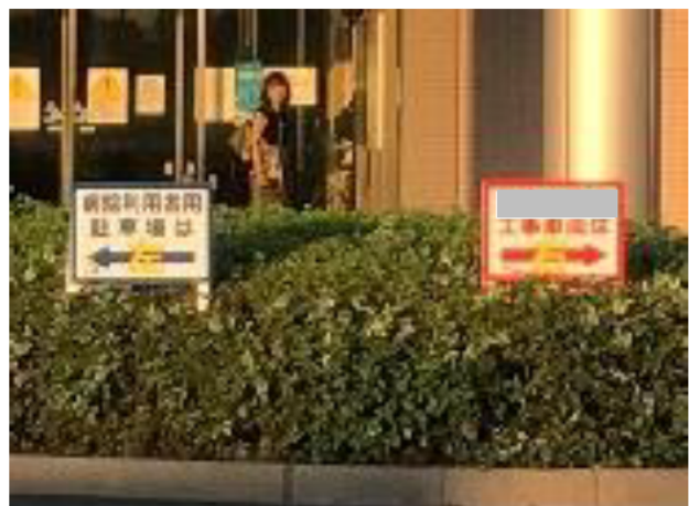
写真④（車両通行ルート案内看板）