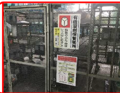
有機溶剤保管場所の明示