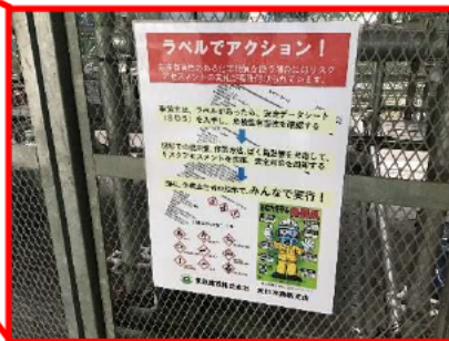
リスクアセスメントの実行宣言