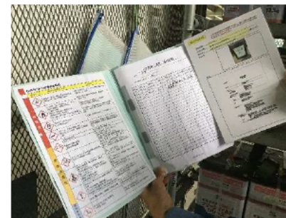
SDSと取扱い周知会情報を常備