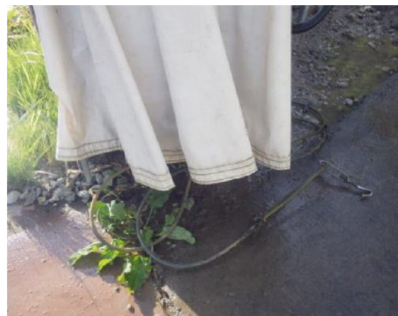
②ターンバックルを使ってゲート解放時はワイヤーを外す