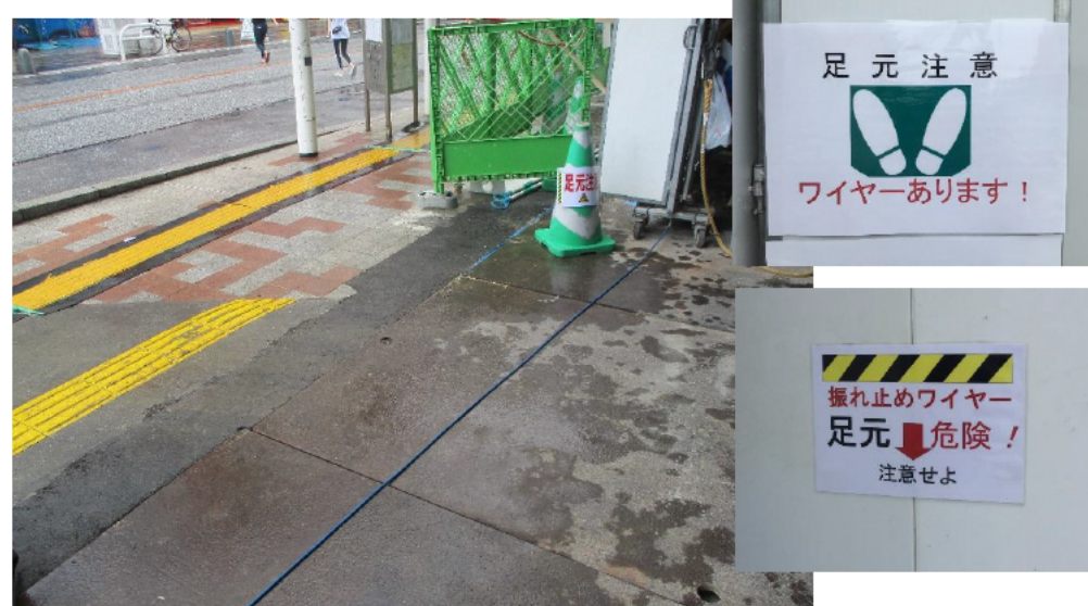
①ワイヤーのペイントと足元注意表示