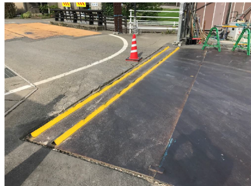
③アングルを使用して振れ止めワイヤーを撤去