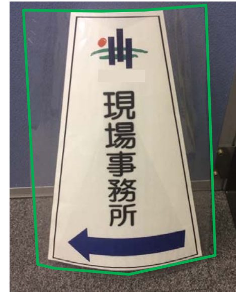
③ラミネート完了状況