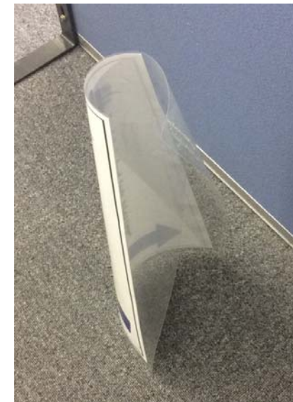
④表示完成 カラーコーンにかぶせるだけ