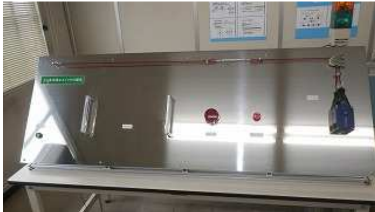
緊急停止体験装置