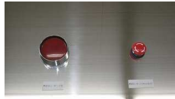
オペレーターが危険を感じたり機械設備に異常が 発生したりした場合、手動で操作するスイッチ