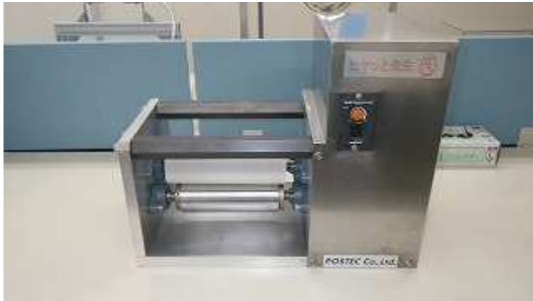
巻き込まれ体験装置

巻き込まれ体験装置によって ロールに手が挟まれるとロール に手をもっていかれることが体 感できる