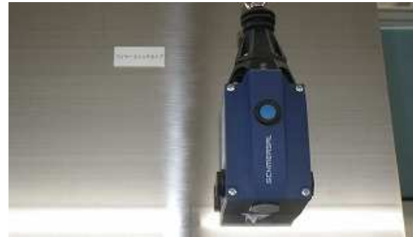
人が機械に巻き込まれない様に自動停止するための装置