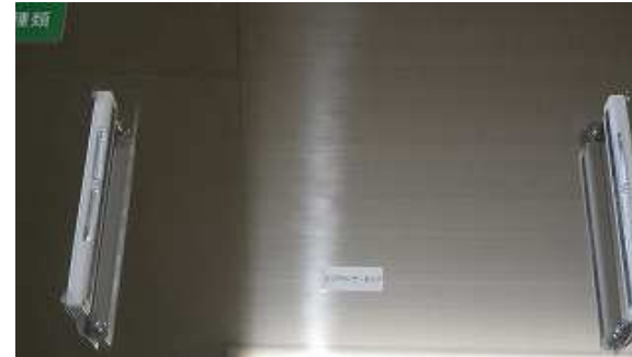
人や物が侵入したときに自動停止するための装置