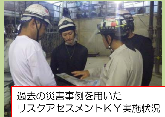
過去の災害事例を用いた リスクアセスメントKY実施状況