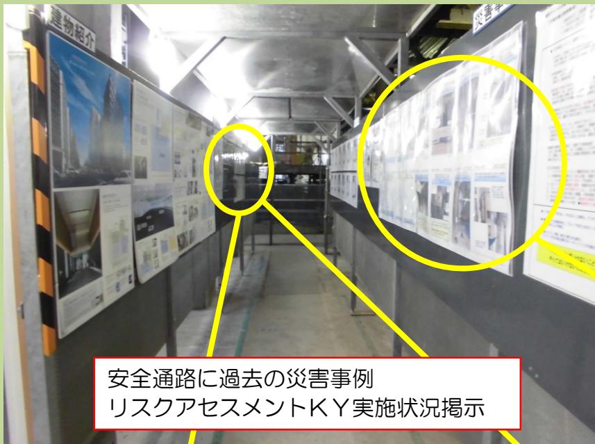
安全通路に過去の災害事例 リスクアセスメントKY実施状況掲示