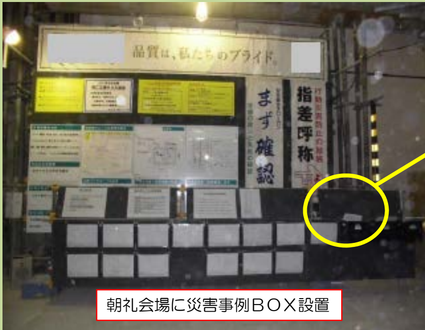
朝礼会場に災害事例BOX設置