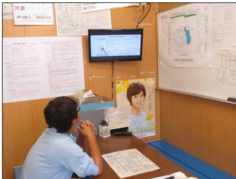
②-2 新規入場者教育状況 (新規入場者受講中)