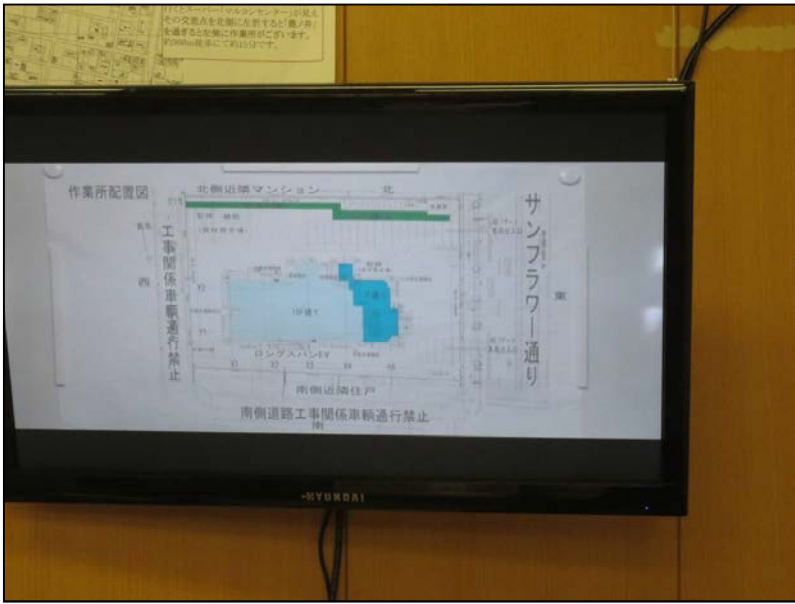
②-4 モニター拡大(作業所配置説明状況)