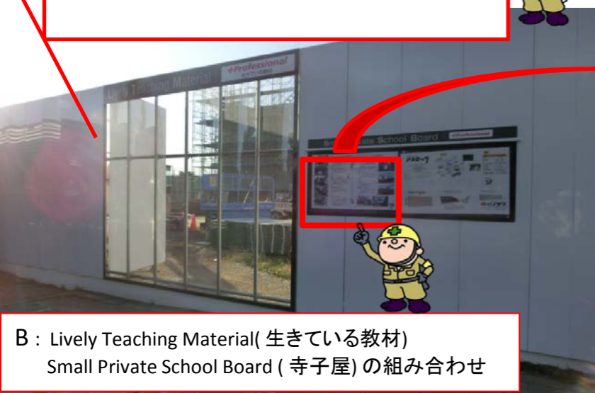
B: Lively Teaching Material( 生きている教材) Small Private School Board ( 寺子屋) の組み合わせ