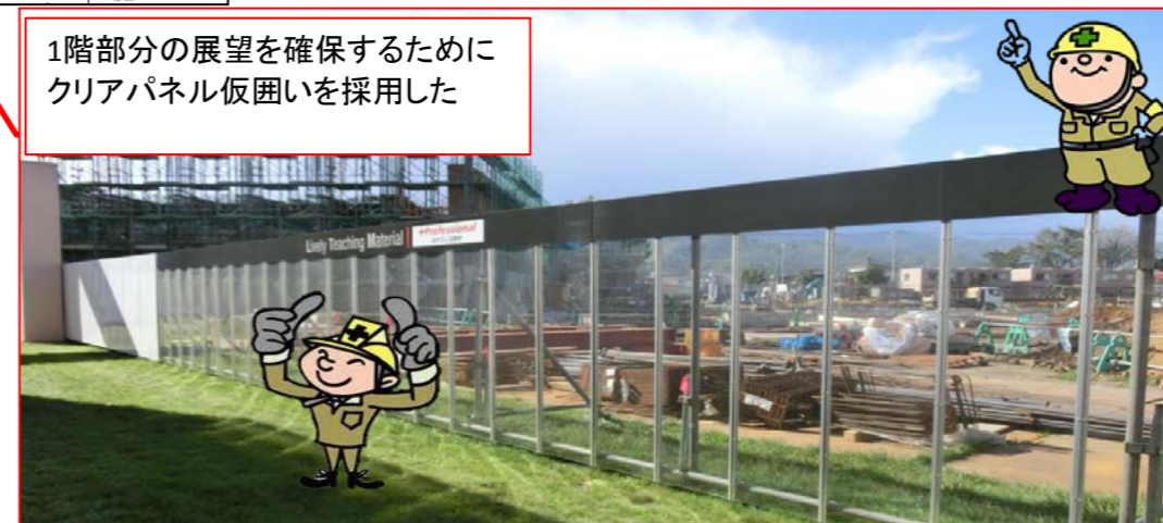
成果 展望ゾの安全意識の向上に繋がった一や仮囲いにクリアパネルを採用することで、現場内の整理整頓と作業員のプロ意識の向上に繋がった