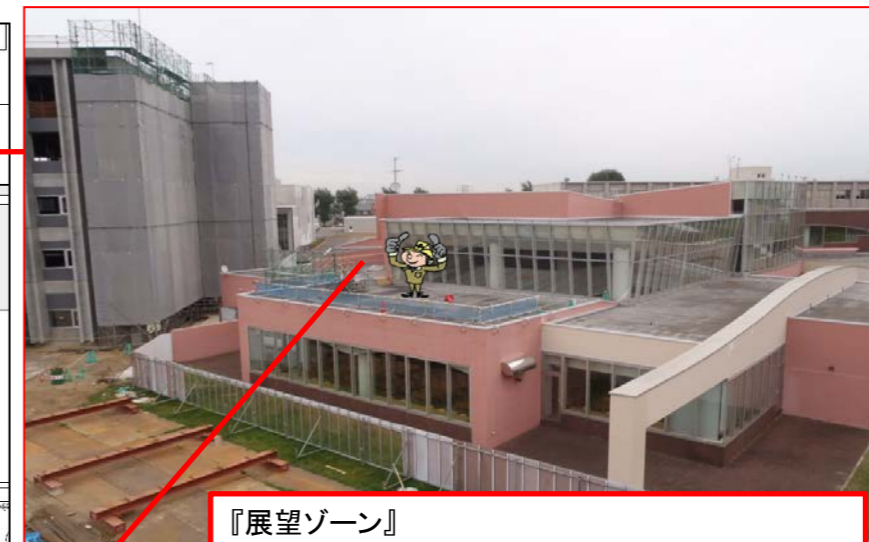
『展望ゾーン』 学生が現場に興味を持って貰える様に食堂2階の屋上部分に展望ゾーンを設置した