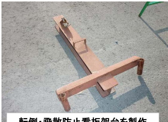
転倒・飛散防止看板架台を製作