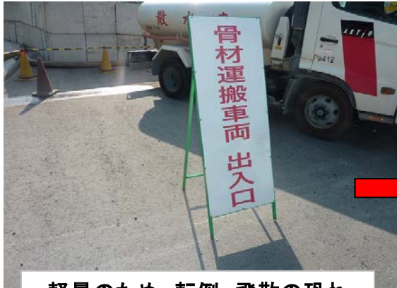
軽量のため、転倒、飛散の恐れ