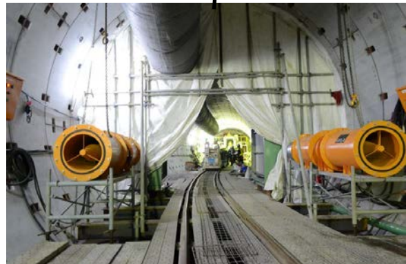
集煙機稼動時の坑内状況(非常にクリアな視界確保)