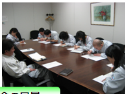
安全対話会の風景