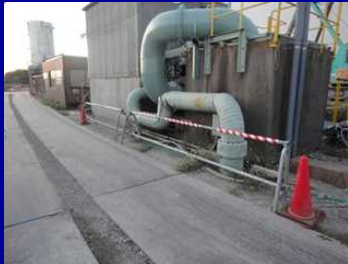
工事車両運転者への既設設備注意喚起