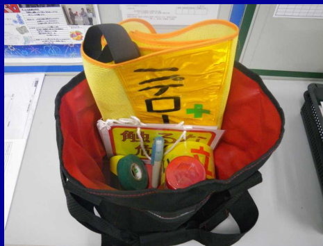
安全パトロールセット マーキンググッズ