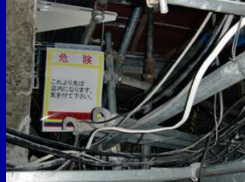
天井内での工事エリア境界部表示