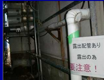
既設パイプ配管の注意喚起表示