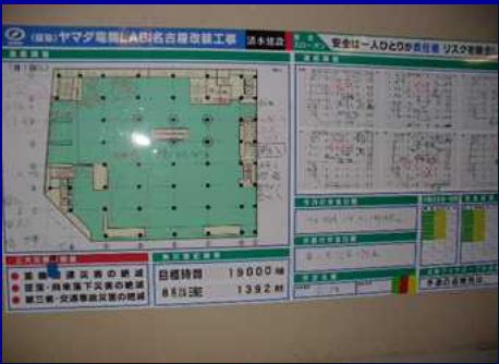
改修工事IPの調整板