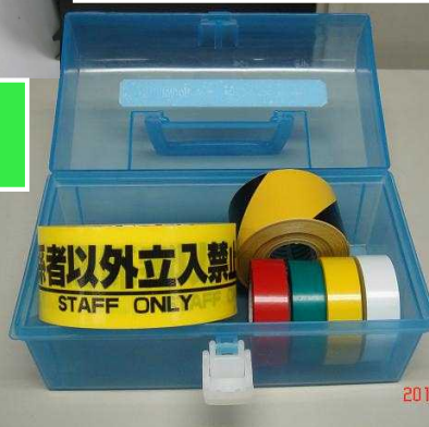
危険箇所 マーキンググッズ箱