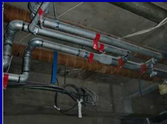
既設パイプ配管のマーキング