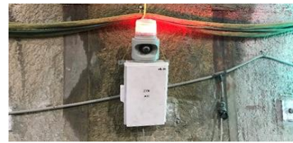
停止時: 赤+サイレン