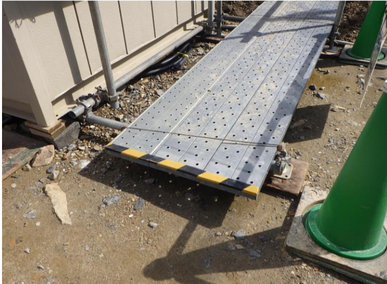
②: 詰所ハウス横安全通路