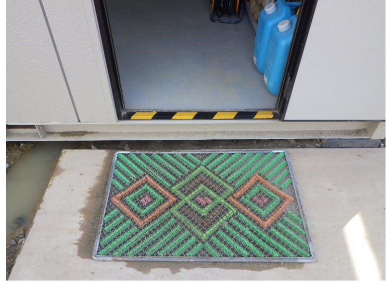
①: 詰所ハウス入り口