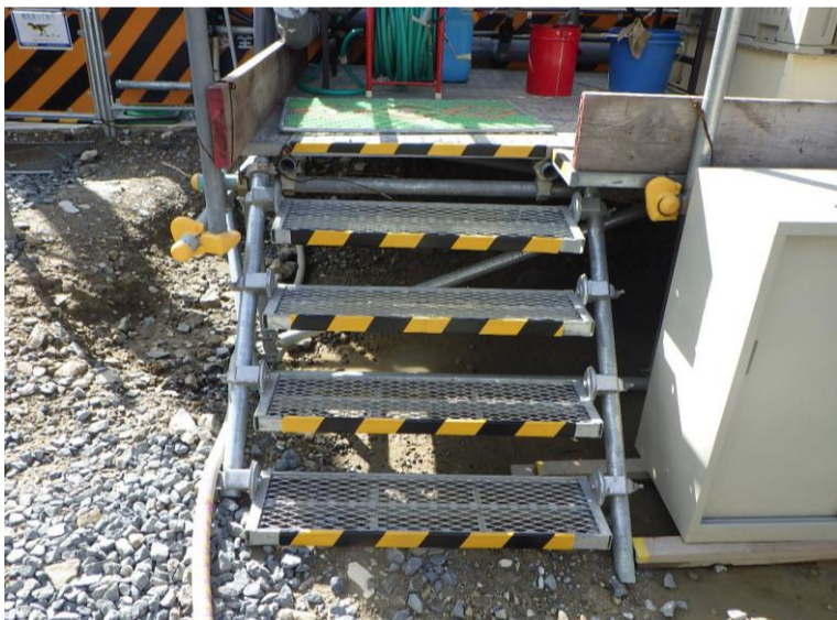
④: 南側歩廊足場昇降