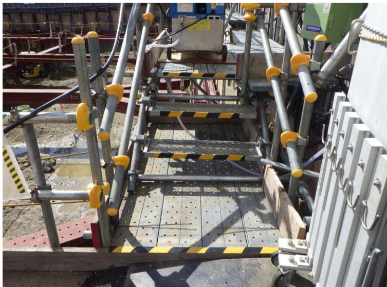
⑥: 北側歩廊足場昇降