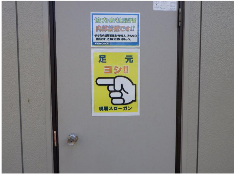
看板を掲示し、トラテープで明示