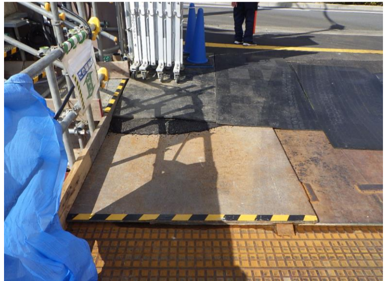
⑦: 北側ゲート前敷鉄板