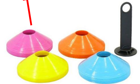
【マーカークーン】 サッカーのドリブル練習に使用する 品物を流用した(1セット40枚)