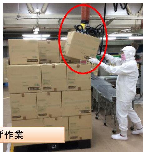
機械を使つての積み上げ作業