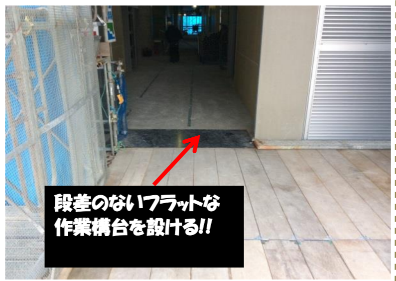
段差のないフラットな作業構台を設ける!!