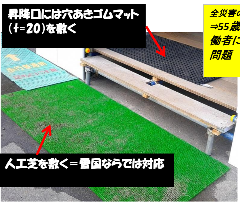
昇降口には穴あきゴムマット(+20)を敷く 人工芝を敷く=雪国ならでは対応