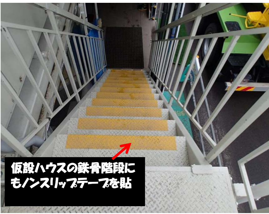
仮設ハウスの鉄骨階段にもノンスリップテープを貼

全災害の25%が転倒による災害 ⇒55歳以上が3分の1を占める建設労働者にとっては看過できない切実な問題