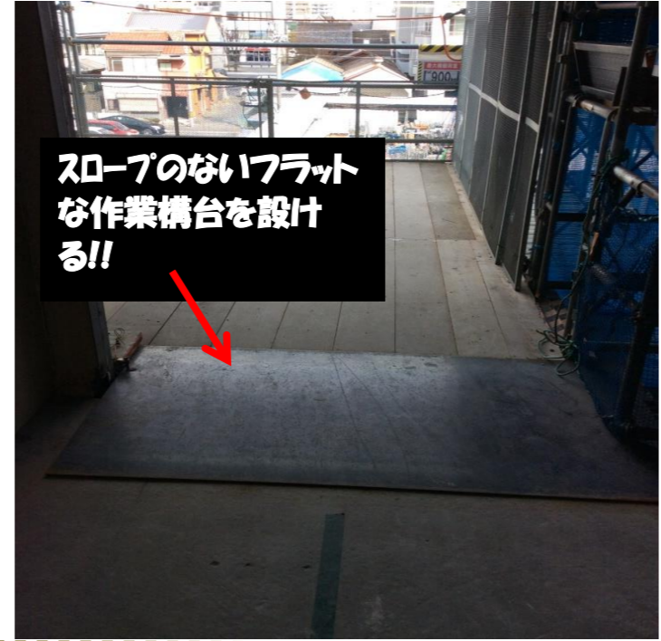
スロープのないフラットな作業構台を設ける!!