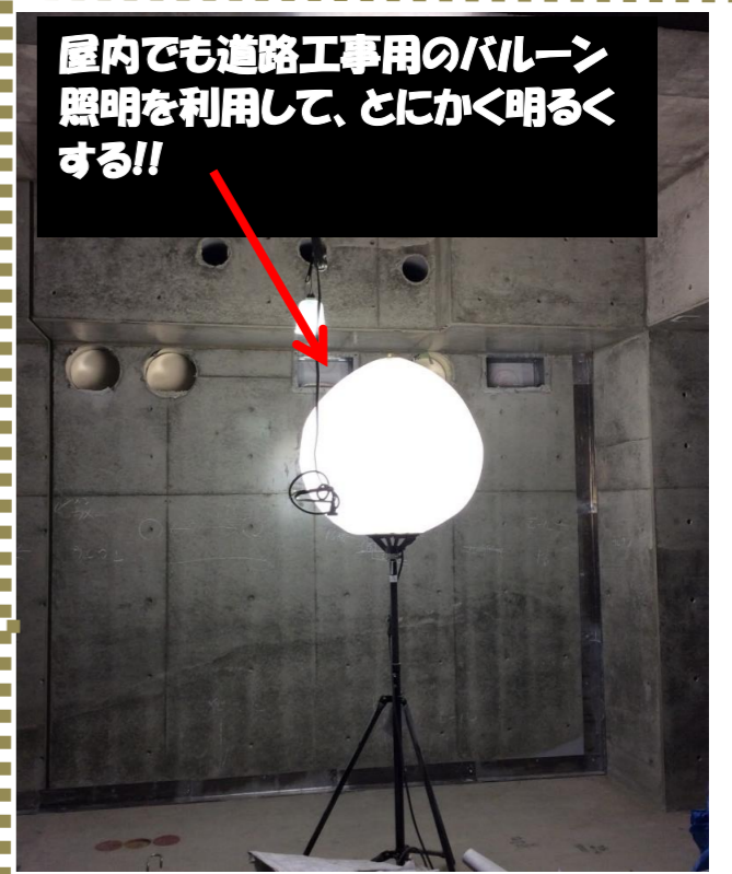
屋内でも道路工事用のバルーン照明を利用して、とにかく明るくする!!