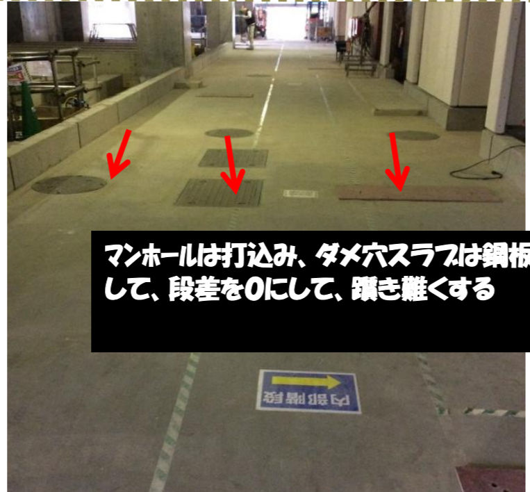
マンホールは打込み、ダメ穴スラフは鋼板蓋にして、段差を0にして、躓き難くする