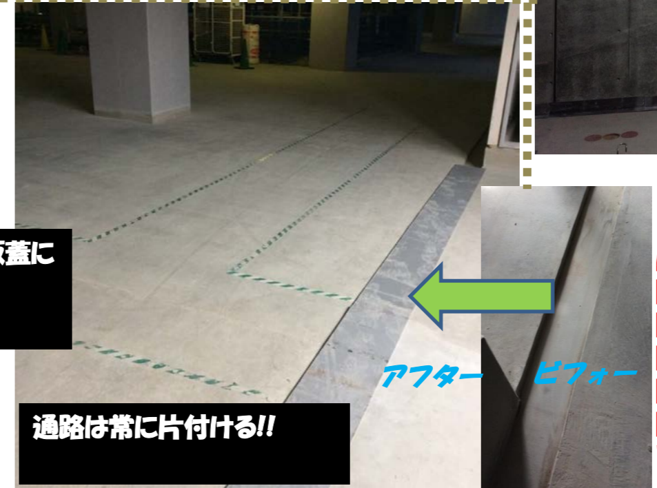
通路は常に片付ける!!