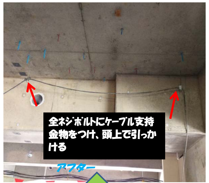
全ネジボルトにケーブル支持金物をつけ、頭上で引かける