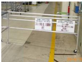
1) 隔離柵と立入り禁止表示設置 2) 回転灯と音声による警報設置