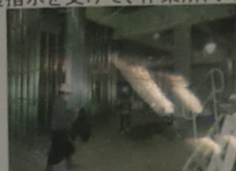
作業を中断し避難

③避難指示を受けて、作業所内の全作業を中断し全員が朝礼会場に集合する。救護班は被災者を朝礼会場まで運ぶ。