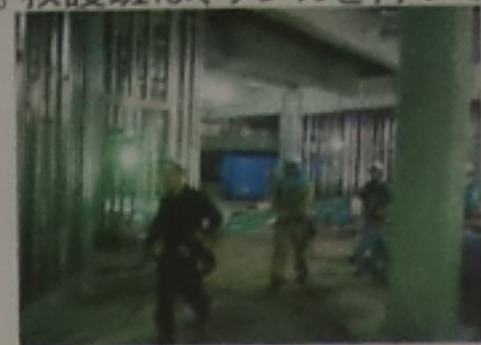
タンカを持って現地向かう

③避難指示を受けて、作業所内の全作業を中断し全員が朝礼会場に集合する。救護班は被災者を朝礼会場まで運ぶ。