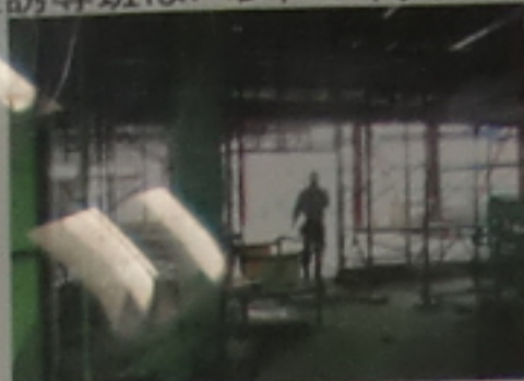
ハンドマイクにて避難指示

②避難誘導班はハンドマイクにて各エリアで直接避難指示。救護班は、タンカを持って被災者の救護に向かう。